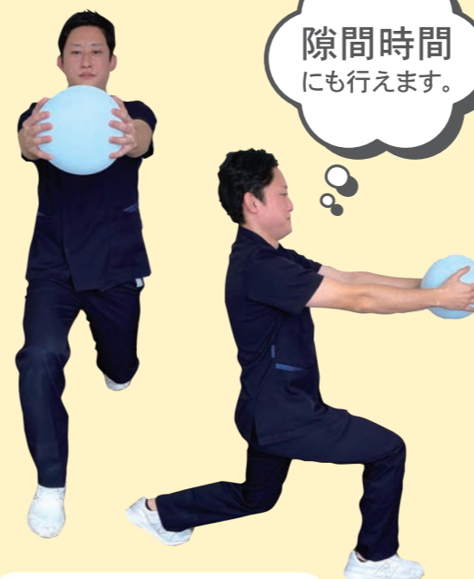
サイドランジ・ボールを持って