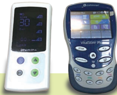
ジェントルスティム バイタルスティム

バイタルスティム：電極を喉に貼り付け、電気(低周波刺激)を流すことで飲み込みに必要な筋力を向上させる事が目的です。