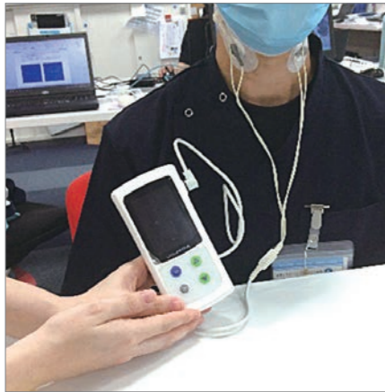
ジェントルスティム使用風景

食物を飲み込みにくい「嚥下障害」の方を対象に、喉に微弱な電流をあてて神経や筋肉に刺激を与えることで、食物を飲み込む反応を速めたり、飲み込みの為に筋力をつけたりする治療に使用される機械です。