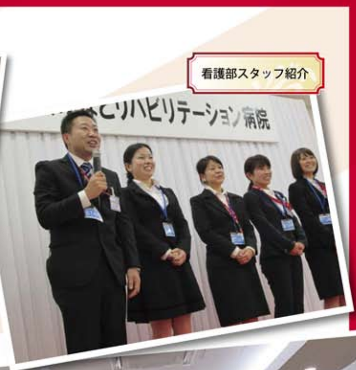
看護部スタッフ紹介